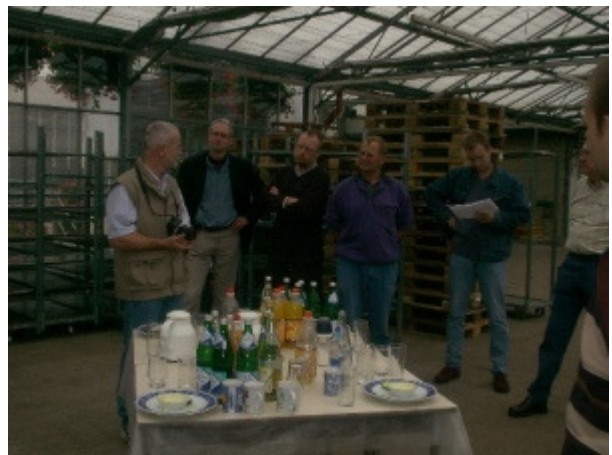
Text und Layout: Christoph Andreas, GBZ Straelen