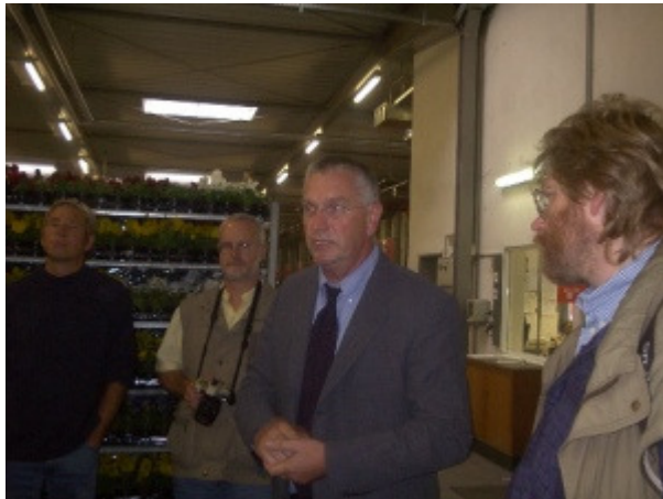
In vier Gemüsebetrieben und der Papenburger- Gartenbauzentrale ...

Alle interessierten Gärtner, die sich mit dem Anbau von Gemüse auf Substrat befassen, sind herzlich zu einer Mitgliedschaft bei der Kompetenzgruppe Substratanbau eingeladen. Anmeldung über E-Mail christoph.andreas@lwk.nrw.de vom GBZ Straelen. Das nächste Treffen ist 2003 im Raum Erfurt oder Münster vorgesehen.