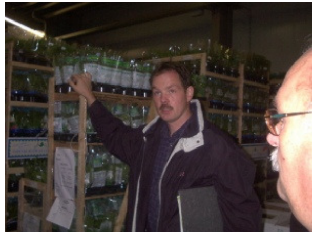
... wurde über aktuelle Fragen und Probleme im Substratanbau diskutiert!