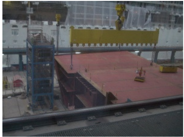
Blick in die Meyer-Werft